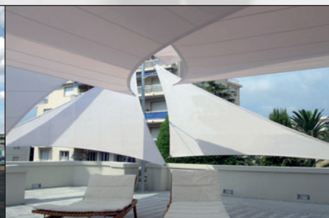
VELAS DE SOMBRA