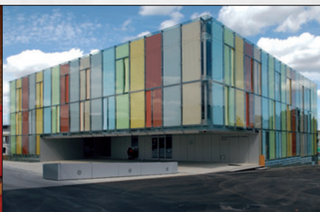
ESTORES EXTERIORES DE FACHADAS